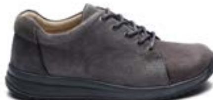
ART.: 70054.2.801 REF.: Grau Fantasy Wildleder mit Grau Stretchsilky-Leder WEITE: K