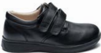
ART.: 70204.3.001 REF.: Schwarz Leder mit Schwarzem Stretchleder WEITE: M