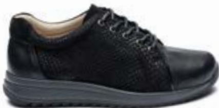
ART.: 70054.3.001 REF.: Schwarz Fantasy Wildleder mit Schwarzem Stretchleder WEITE: K