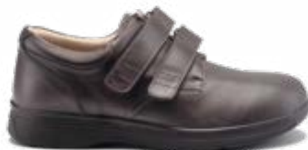
ART.: 70204.3.301 REF.: Braun Leder mit Stretchleder in Braun WEITE: M